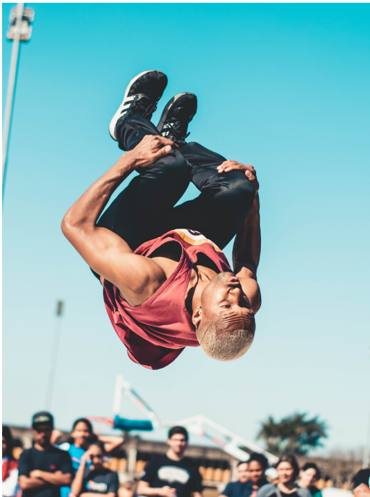
De uitdaging opgezocht